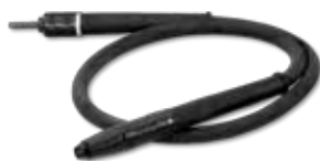
ציר גמיש למשחזת ציר למהירות 20,000-30,000