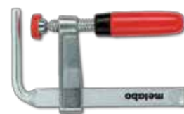
מלחציים לקיבוע מתקן אחיזה