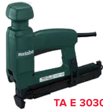
TA E 3030