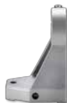
מתקן אחיזה לקיבוע משחזת ציר